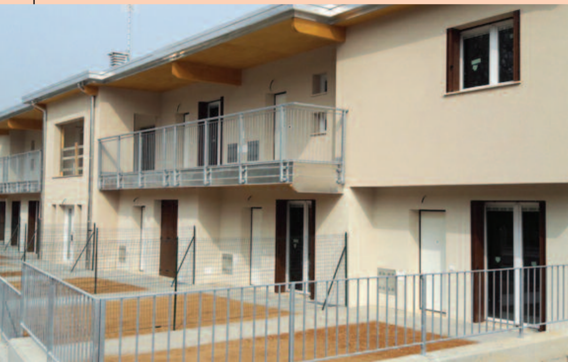
Case in legno si fà per dire... infatti, le due palazzine appena inaugurate in località Lazzaretto a Lonato in Via Padre Marcolini sono due edifici a tutti gli effetti: di classe A e antisismici.